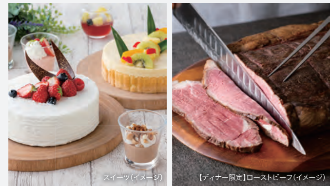
スイーツ(イメージ)