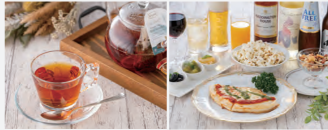
紅茶“ロンネフェルト”(イメージ)

2F The Season Cafe & Lounge ザ・シーズンカフェ&ラウンジ