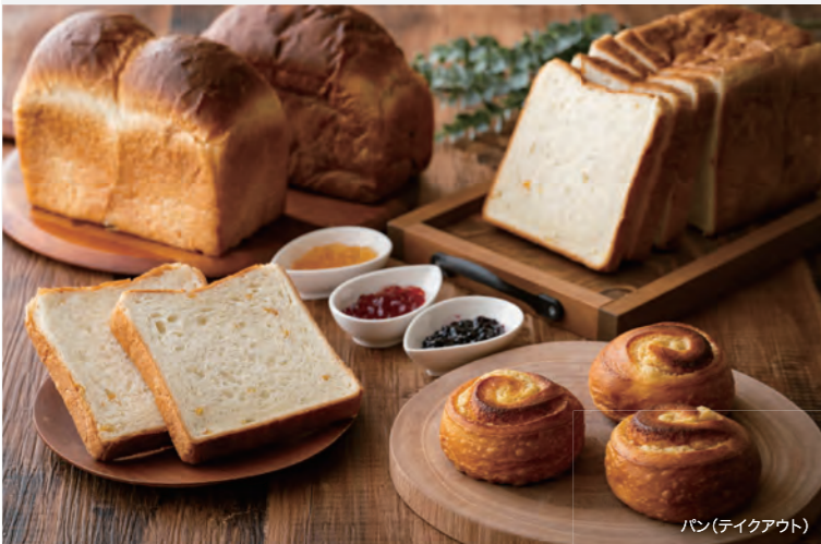
パン(テイクアウト)

2F The Season Cafe & Lounge ザ・シーズンカフェ&ラウンジ