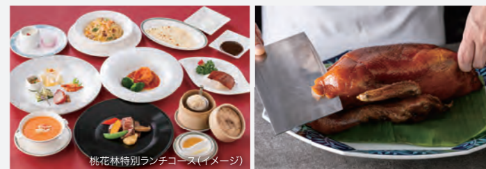
桃花源特別ランチコース(イメージ)

広東料理を中心に幅広いメニューを取り揃えております。一品料理やセットメニュー・コース料理まで、オークラ伝統の中国料理をお楽しみいただけます。